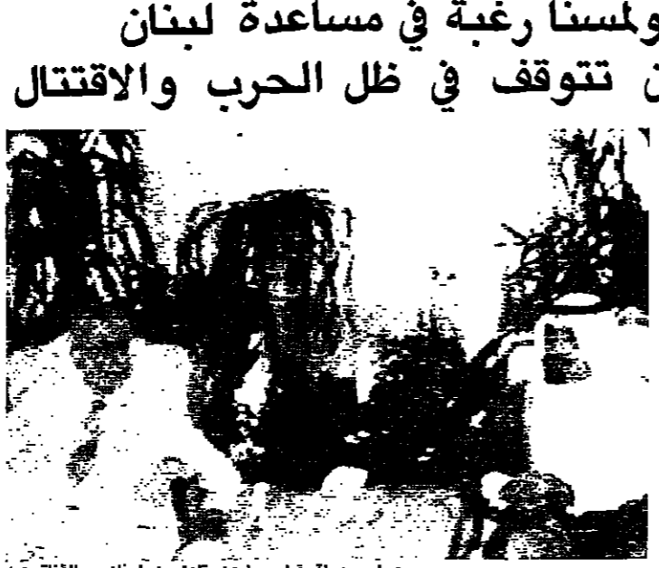
مع امير دولة قطر (عن تلميذين لبناني - الفناة هـ)

ما رايك بمقررات قمة بغداد وانشاء صندوق لدعم لبنان؟ ك: كما تعلمي ان تكون المقررات التي تتعلق بلبنان على مستوى الاحداث الاخيرة وللصيربة التي يمر بها لبنان، ان قر العرب، وهم مشكورون، دعم لبنان لإنشاء صندوق عربي، دولي، ولكن ليسمع في العرب ان خمس بهاتين الكلمتين: ان قمة فلسطين، قررت مساعدة لبنان بمبلغ مليار دولار، ويتبقى لنا نحن في ذمّة العرب من مؤتمر فلسطين و٦٠٠ مليون دولار، مع احتراماً وتقديراً لشعورهم وعاطفتهم لراة انشاء هذا الصندوق، عليهم ان يسدّدوا للبنان، او جزء من الدين على العالم العربي، هذه هي ملاحظاتي حول قمة بغداد وانعكاسها على لبنان، فلفروض ان تكون انعكاساتها ايجابية على الصعيد الاقتصادي، ولو انهم بدأوا بدفع ديونهم لكانوا قد انتهوا منها الان، ولكن الدولار حبط على الاقل فهذا القرار كغيره من القرارات، التي اتخذت منذ ١٥ سنة وحتى الان، فهي مجرد كلام.